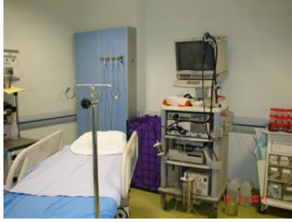
ENDOSKOPI – KOLONOSKOPI ÜNİTESİ